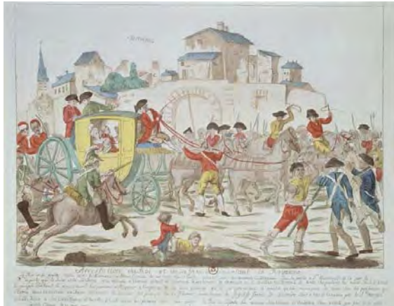
L'arrestation de Roi à Varennes le 21 juin