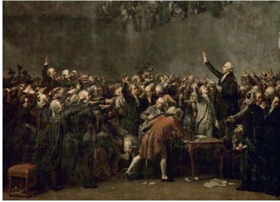
Serment du Jeu de Paume

Il prit ensuite la parole pour mettre la colonie de Saint-Domingue sous la protection de l'assemblée nationale : ainsi avant tout le monde, il proclamait le tiers état pour la nation. La discussion s'étant ensuite ouverte sur une adresse au Roi, Gouy-d'Arsy présenta aussi son projet. Quelques jours après (27 juin), la validité de ses pouvoirs fut unanimement reconnue par l'Assemblée, qui se partagea sur le nombre des députés de Saint-Domingue. Gouy-d'Arsy voulait qu'ils fussent portés à vingt ; on n'en admit que six. Pendant le cours de cette discussion l'assemblée reçut (4 juillet) une pétition des colons de Saint-Domingue, qui réclamaient contre la nomination de ceux qui s'étaient présentés comme leurs députés 1 . Brûlant, ainsi que tant d'autres, de l'ambition de jouer un rôle dans le renversement de la monarchie, il se jeta en aveugle parmi les factieux, parce que c'était parmi eux qu'il était plus aisé d'acquérir de la célébrité. Son dévouement aux démagogues lui valut pour tout avantage d'être maire de Moret et commandant de la garde nationale de Fontainebleau. Dans l'assemblée il se donna