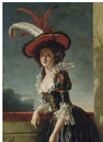
Louise Élisabeth de France, duchesse de Parme, en 1753

Louis-Marthe de Gouy d'Arsy naît à Paris, au Vieux-Louvre, le 15 juillet 1753 ; il est baptisé le 28 suivant, en la chapelle du château de Compiègne, avec pour parrain le Dauphin, fils aîné de Louis XV et père de Louis XVI, et pour marraine la duchesse de Parme, aînée des enfants de Louis XV.