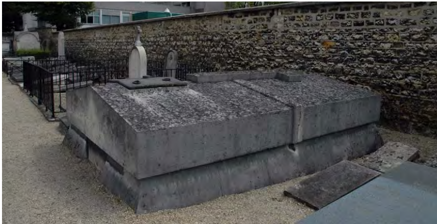
Tombe de Louis-Marthe de Gouy d'Arsy au cimetière de Picpus à Paris

Louis-Marthe décide alors de se présenter aux élections des députés aux états généraux. Il faisait alors partie de ces nobles qui émettaient des idées neuves et montraient des sentiments élevés et prononçaient des discours animés d'un esprit libéral . Il n'est élu que suppléant par l'assemblée de la noblesse des bailliages de Melun et de Moret 6 , mais il obtient que l'île de Saint-Domingue soit également représentée à Versailles et il siège alors comme titulaire avec les représentants du Tiers État, participe au Serment du Jeu de Paume et est l'un des auteurs de l'appellation Assemblée Nationale. En 1790, il propose la création des Assignats et fait choisir Marines comme chef-lieu du canton. Il s'oppose en 1791 à l'émancipation des esclaves, craignant la guerre civile à cause de l'isolement provoqué par le blocus anglais. Il reprend la carrière militaire sous la Législative et est arrêté, selon la loi des suspects en Septembre 1793 par Collot d'Herbois, alors en mission dans l'Oise. Il est guillotiné le 23 Juillet 1794 place du Trône Renversé (Nation aujourd'hui), six jours avant ceux qui le condamnèrent, et est enterré au cimetière de Picpus.