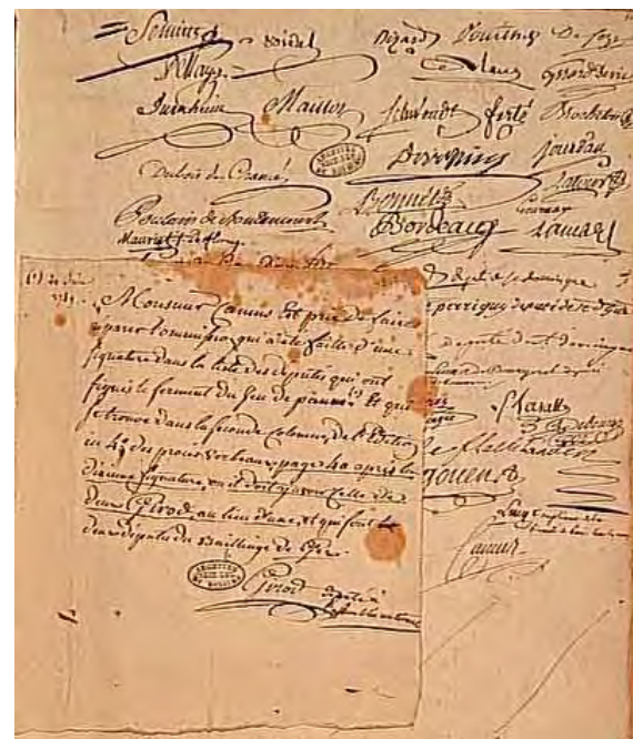
Registre du procès-verbal du Serment de Jeu de Paume, 20 juin"

précieux, les états généraux devaient s'ouvrir le 4 mai, et les élections de Paris n'étaient pas encore faites. Gouy-d'Artsy et ses onze collègues, les prétendus députés de Saint-Domingue, ne cessèrent pas, depuis le moment où la chambre du tiers état procéda comme une assemblée indépendante, d'assister à ces réunions, mais sans en avoir le droit. Ainsi l'on peut dire qu'il fut le premier de l'ordre de la noblesse à se réunir officiellement au tiers état. Le 13 juin il demanda que la députation de Saint-Domingue fût appelée avec les autres bailliages. Cette prétention fut admise, bien que les pouvoirs de Gouy-d'Artsy et de ses collègues fussent de toute nullité, puisque le gouvernement n'avait convoqué aucune assemblée électorale dans la colonie, et qu'il persistait à ne point reconnaître leur élection. Mais dans un moment où l'on eût voulu faire de tous les français autant de conjurés , dit l'historien déjà cité, on n'y regarda pas de si près et la vérification des pouvoirs fut ordonnée. Dans la fameuse séance du Jeu de Paume (20 juin), l'assemblée vota unanimement l'admission provisoire des douze députés de Saint-Domingue ; et Gouy-d'Artsy, ainsi que ses collègues, prêta serment au milieu des applaudissements et des cris de Vive le Roi !