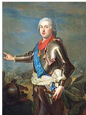
Louis-Ferdinand de Bourbon, dauphin de France, en 1747