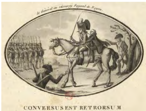
Caricature signée de Vinck

A la fin de la session il fut nommé maréchal de camp. Chargé d'aller rétablir l'ordre à Noyon, il s'y conduisit avec une faiblesse qui le rendit ridicule aux yeux de tous les partis. L'assemblée législative ordonna qu'il lui serait rendu compte des instructions qui avaient été données. Le général écrivit lui-même, et les choses en restèrent là.