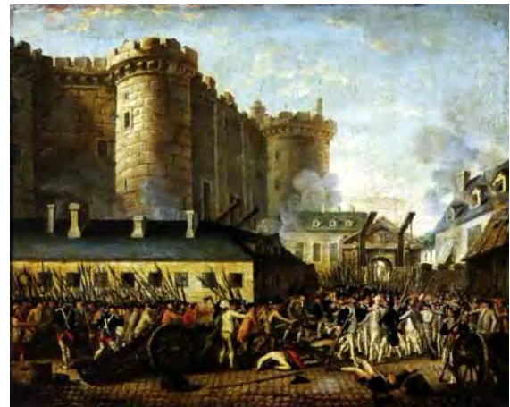
La Prise de la Bastille, le 14 juillet.

tant de mouvement, qu'on prit d'abord son empressement pour de la capacité : on le nomma membre du comité des finances 2 , puis de celui des domaines ; il était en outre un des commissaires de la salle. Tels sont, dit un contemporain, les hochets que lui ont valu ses petites réclamations contre le despotisme. Le 13 juillet 1789, jour du renvoi de Necker, Gouy-d'Arsy déplora cet événement comme une calamité publique, fit d'un ton d'inspiré l'apologie du ministre genevois, et accusa la cour des plus sinistres projets : l'on entend de tous côtés, dit-il, des cris d'épouvante et d'horreur. Le despotisme rassemble autour de nous des troupes étrangères, comme s'il méditait contre la patrie quelque coup dont les troupes nationales ne voudraient pas se rendre complices.