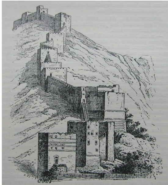
Les murs d'Antioche

Il avait épousé Adelle, fille et héritière du comte de Vermandois et de la comtesse de Valois, qui lui apporta en dot ces deux comtés. Il est à ce titre le fondateur de la lignée des comtes de Vermandois capétiens.