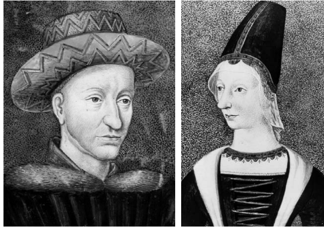
Charles VII et son épouse, Marie d'Anjou