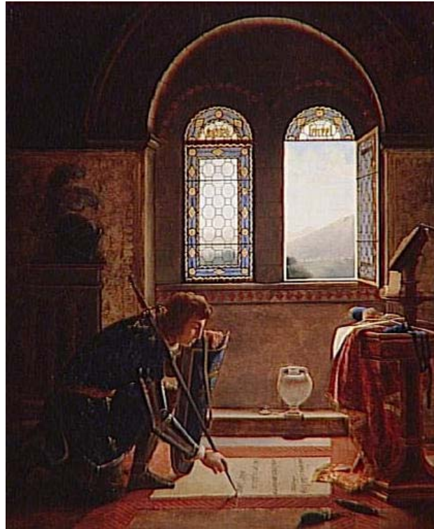
Charles VII écrivant ses adieux à Agnès Sorel Musée des châteaux de Malmaison et Bois Préau

Sur le plan privé, Charles VII connaîtra une grande passion avec Agnès Sorel. De cet adultère (Charles VII était marié à Marie d'Anjou), il naîtra trois filles, dont Carlote de laquelle nous descendons. Mais cette liaison s'achèvera en 1449, Agnès Sorel est emportée par un flux de ventre (probablement suite à un empoisonnement). Charles VII en sera profondément atteint.