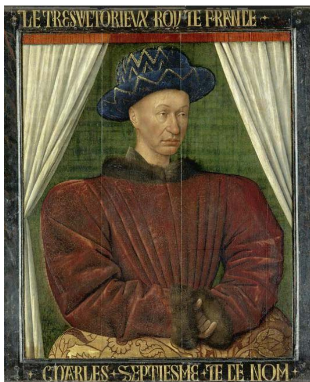
Tableau de Jean Fouquet vers 1455

Il rencontre Jeanne d'Arc à Chinon en 1429