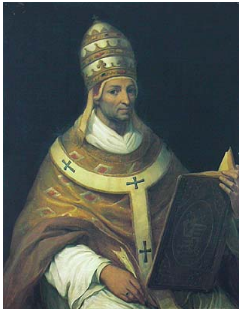
Portrait de Jean XXII par Henri Ségur Palais des papes Avignon

Élu pape, sous le nom de Jean XXII, en 1316