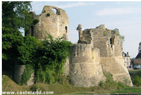
Château de Conches

En 1217, Robert de Courtenay jure fidélité à Philippe Auguste, et consent au roi l'aide de tous les vassaux des châtelainies de Conches, Nonancourt et Champignolles. Cette même année son frère, Pierre, est couronné empereur de Constantinople.