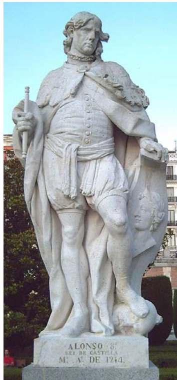
Statue d'Alphonse VIII à Madrid