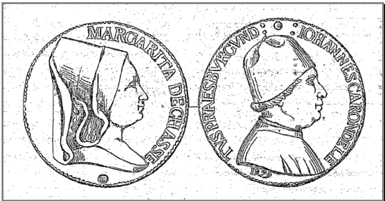
Médaille de 1479, conservée au cabinet des Médailles de la Bibliothèque nationale à Paris, représentant le chancelier Jean Carondelet et sa femme Marguerite de Chasley

Jean fit partie de la croisade menée par Sigismond de Luxembourg et fut fait prisonnier à la désastreuse bataille de Nicopolis le 25 septembre 1396.