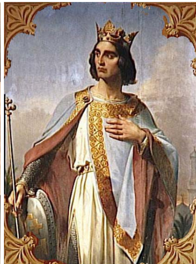
Baudouin de Boulogne 2 ème roi latin de Jérusalem