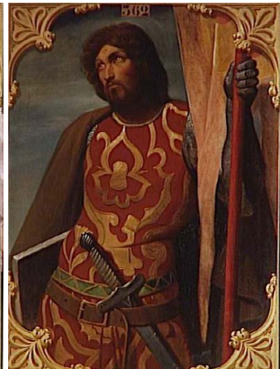
Eustache III de Boulogne Père de la reine d'Angleterre