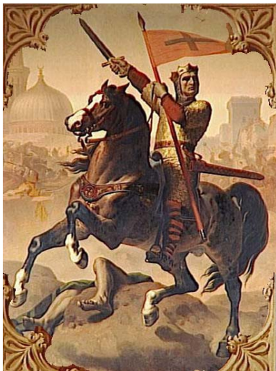
Godéfroi de Bouillon 1 er roi latin de Jérusalem